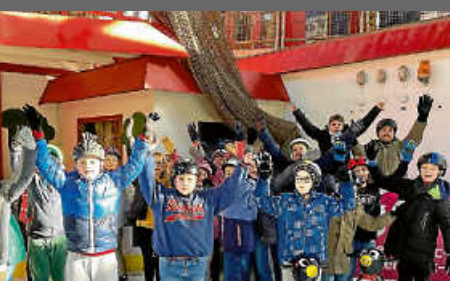
Besuch im Polaron