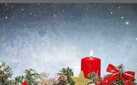
Zum 1. Advent