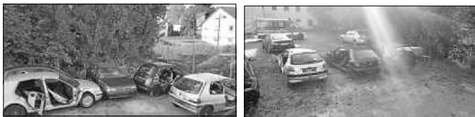
Autos der Übungen

Wir bedanken uns recht herzlich bei den Firmen Auto Morof, Stahl Auto Service und Firma Auer für die Bereitstellung von Anhängern, Fahrzeugen und Werkzeug.