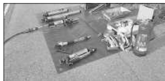
Werkzeug Technische Hilfeleistung

Da unser Einsatzgebiet einige Landstraßen und auch einen Teil der Autobahn umfasst, werden wir oft zu Verkehrsunfällen alarmiert. Das bedeutet, dass wir jederzeit darauf vorbereitet sein müssen. Jede/r Feuerwehrangehörige/r muss daher mit den Gerätschaften