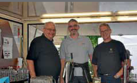
Rückblick Jubiläumsmusikfest Musikverein