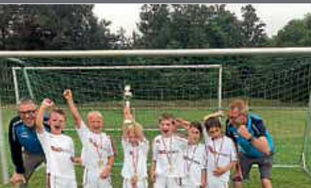
TSV Bambini Spieltag